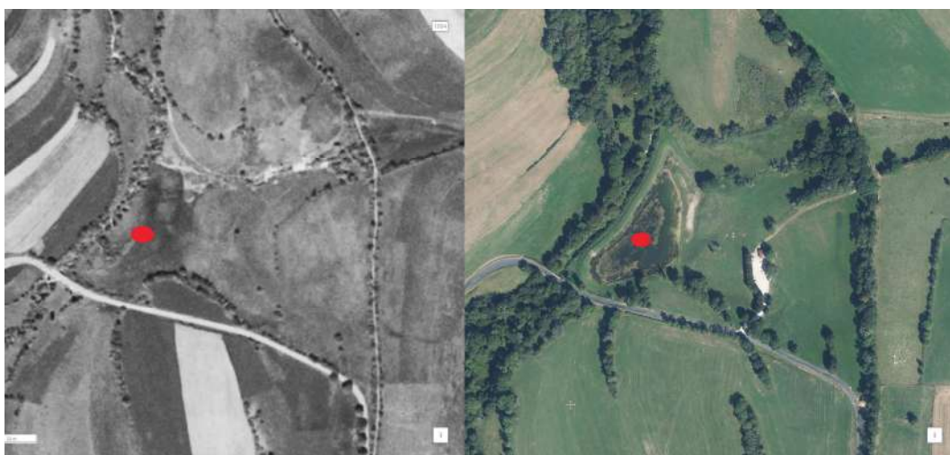
Figure 1 : Photo aérienne en 1954 (gauche) - en 2021 (droite).

Le plan d'eau de la Vendrolière est un bassin d'environ 8 000 m 2 en bordure du Séran, séparé de la rivière par une digue, construite avec les matériaux du site (prélevés lors des terrassements du bassin) dans les années 90 par l'ex-district du Valromey. Il est la propriété actuelle du SIVOM du Valromey.