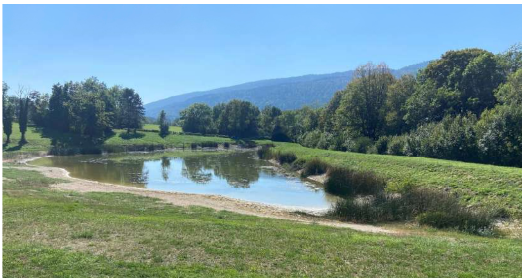
Photo 1 - Etang de la Vendrolière avant travaux le 11/09/2023