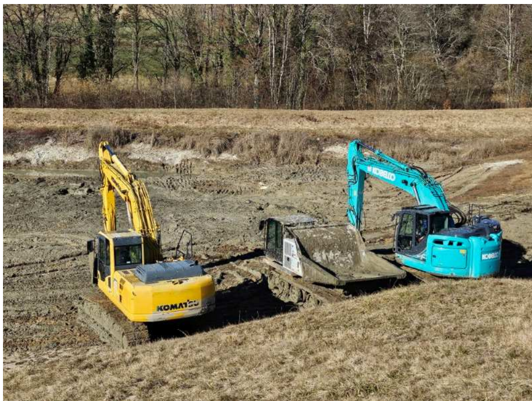
Photo 2 - Travaux de curage après vidange de l'étang le 02/02/2024

Ce sont environ 1 200 m 3 de matériaux qui ont été extraits.