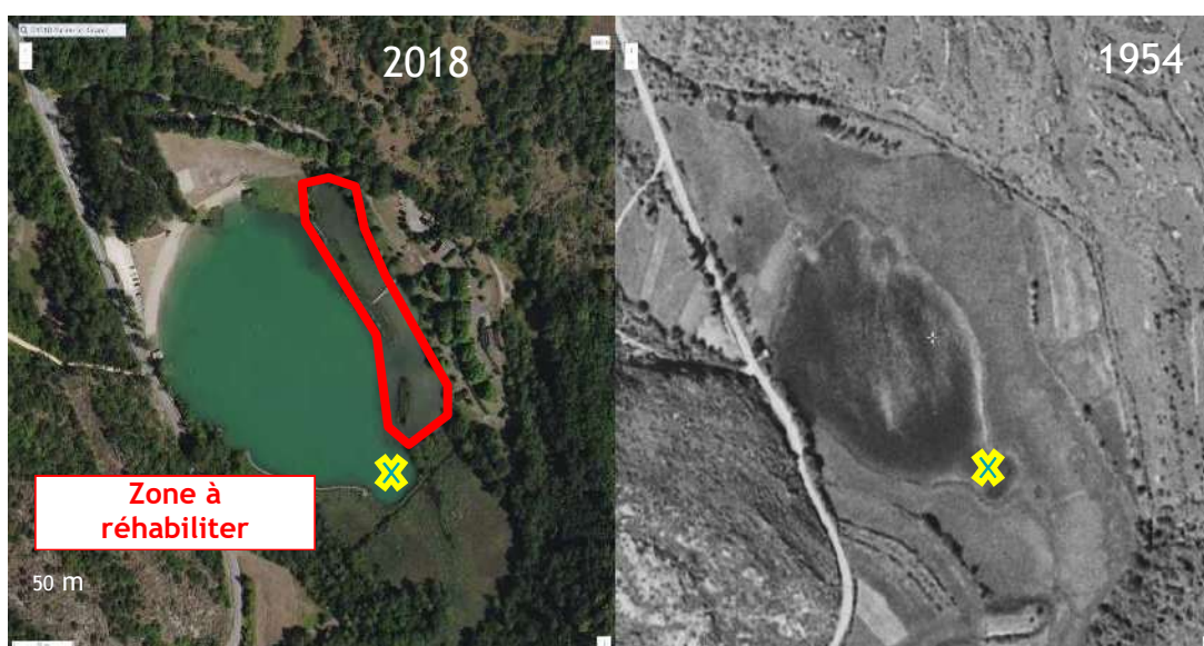
Figure 2 Photos aériennes lac de Virieu le Grand

Les matériaux sédimentaires extraits ont été déposés sur le lac (nord) de Virieu le Grand dans le cadre de la réalisation d'un autre projet, qui consiste en la réhabilitation environnementale de la bordure lacustre Est, totalement aménagée dans les années 1970. Cette zone pourra notamment abriter une faune et une flore typique des bordures lacustres, participer à l'épuration de l'eau ainsi qu'à la valorisation paysagère du site.